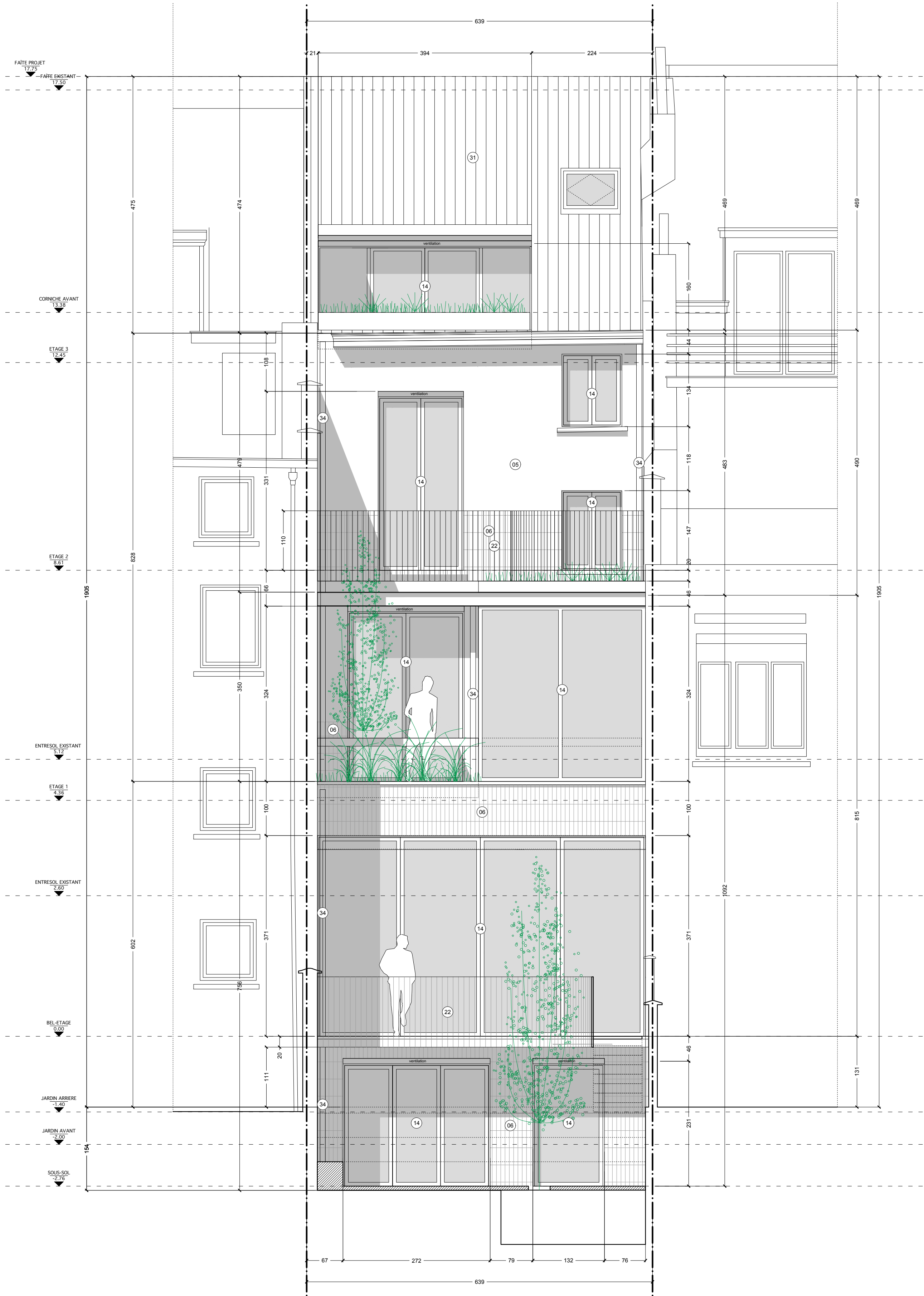
FACADE ARRIERE - 1/50